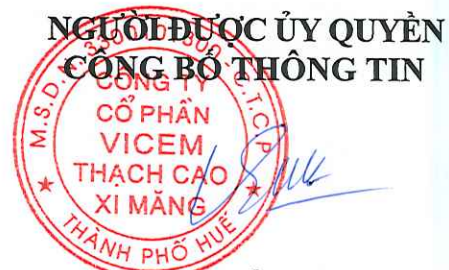
Ngô Quốc Việt