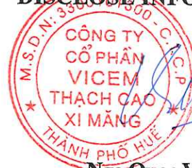
Ngô Quoc Viet

AUTHORIZED PERSON TO DISCLOSE INFORMATION